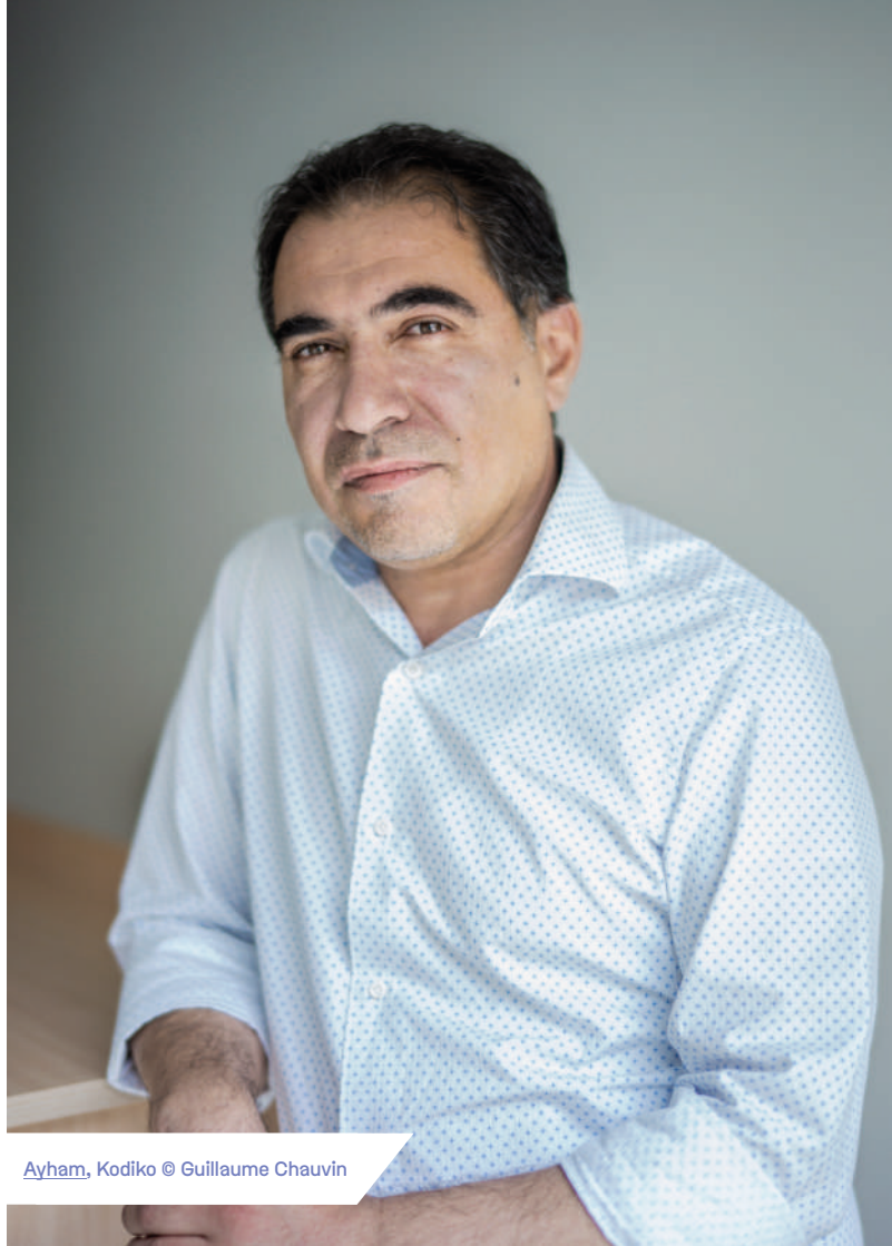
Ayham, Kodiko